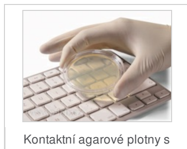
Kontaktní agarové plotny s