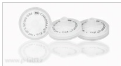
Nástavec filtrační nesterilní - 25