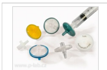
Nástavec filtrační nesterilní - 30

Vyšší rychlost filtrace díky většímu průměru membrány