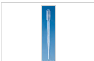
Pipeta pasteurova typ 3