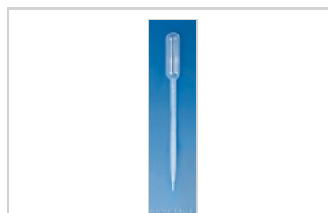
Pipeta pasteurova typ 4