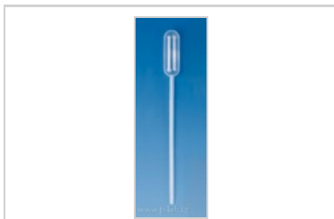
Pasteurova pipeta PE typ 1