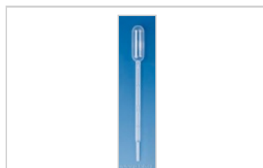
Pasteurova pipeta PE typ 2