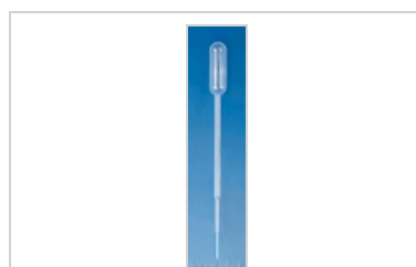
Pipeta pasteurova typ 5