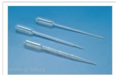
Pasteurova pipeta PE