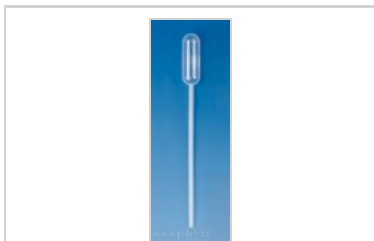
Pasteurova pipeta PE typ 1