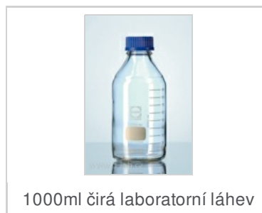
1000ml čirá laboratorní láhev