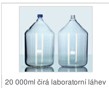
20 000ml čirá laboratorní láhev