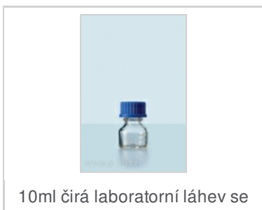
10ml čirá laboratorní láhev se